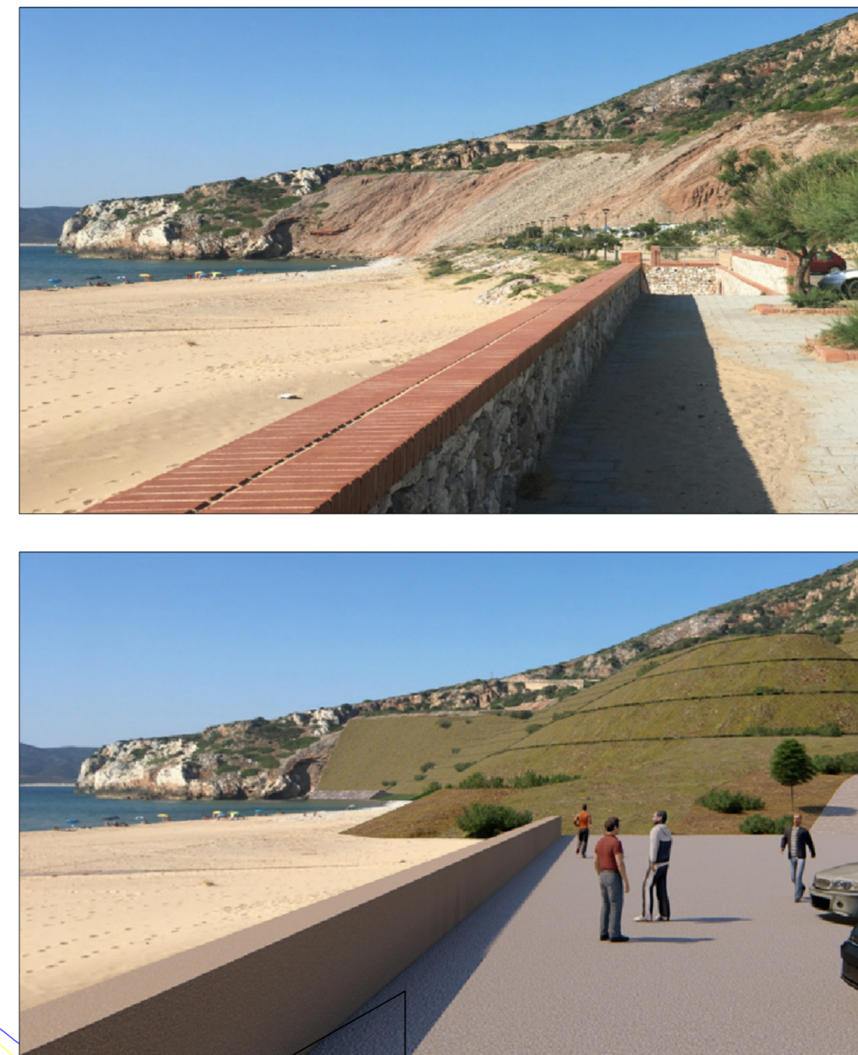
STATO ATTUALE E SIMULAZIONE INTERVENTI DI PROGETTO (C04)