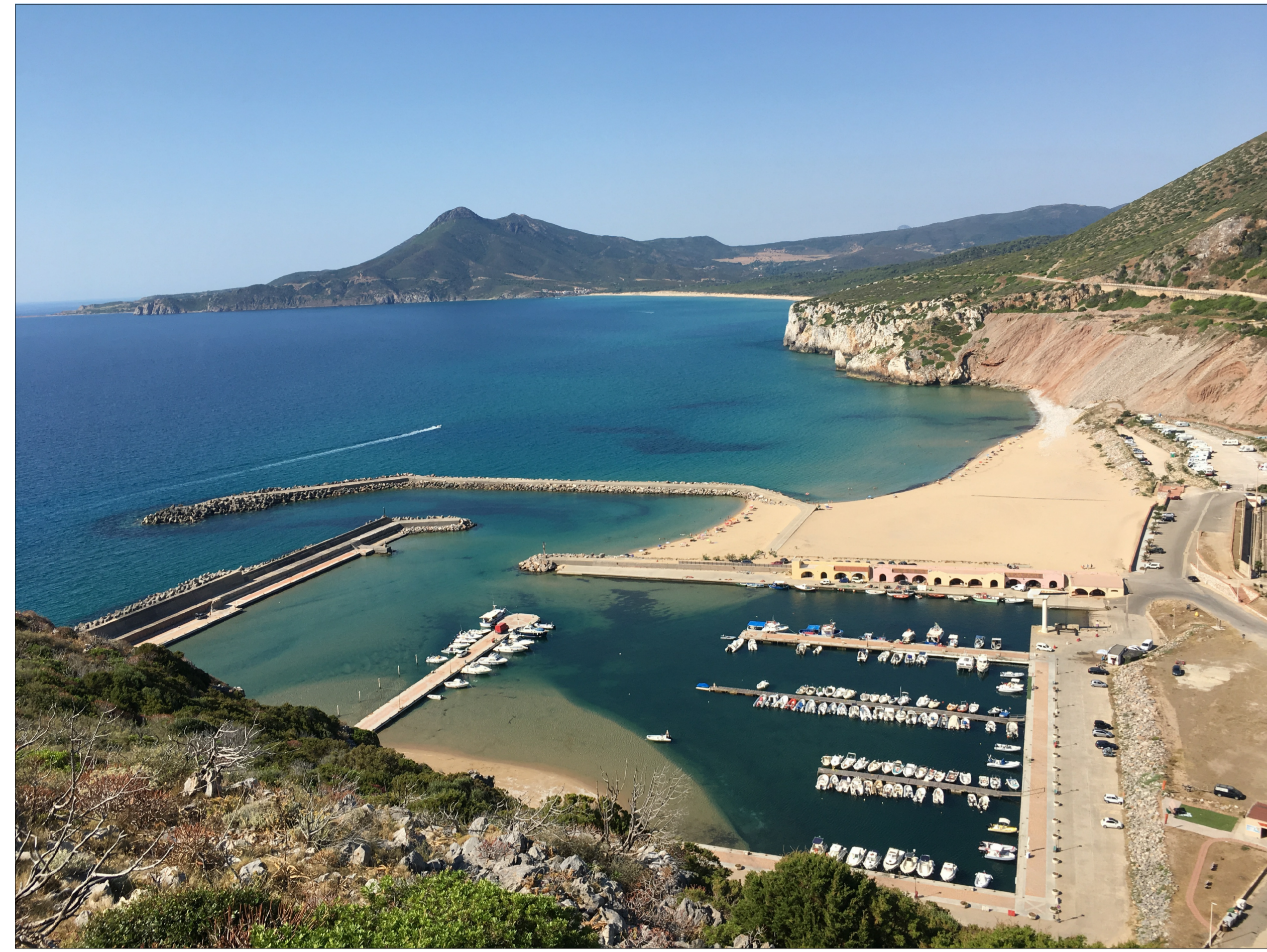
VISTA PANORAMICA STATO ATTUALE (C01)