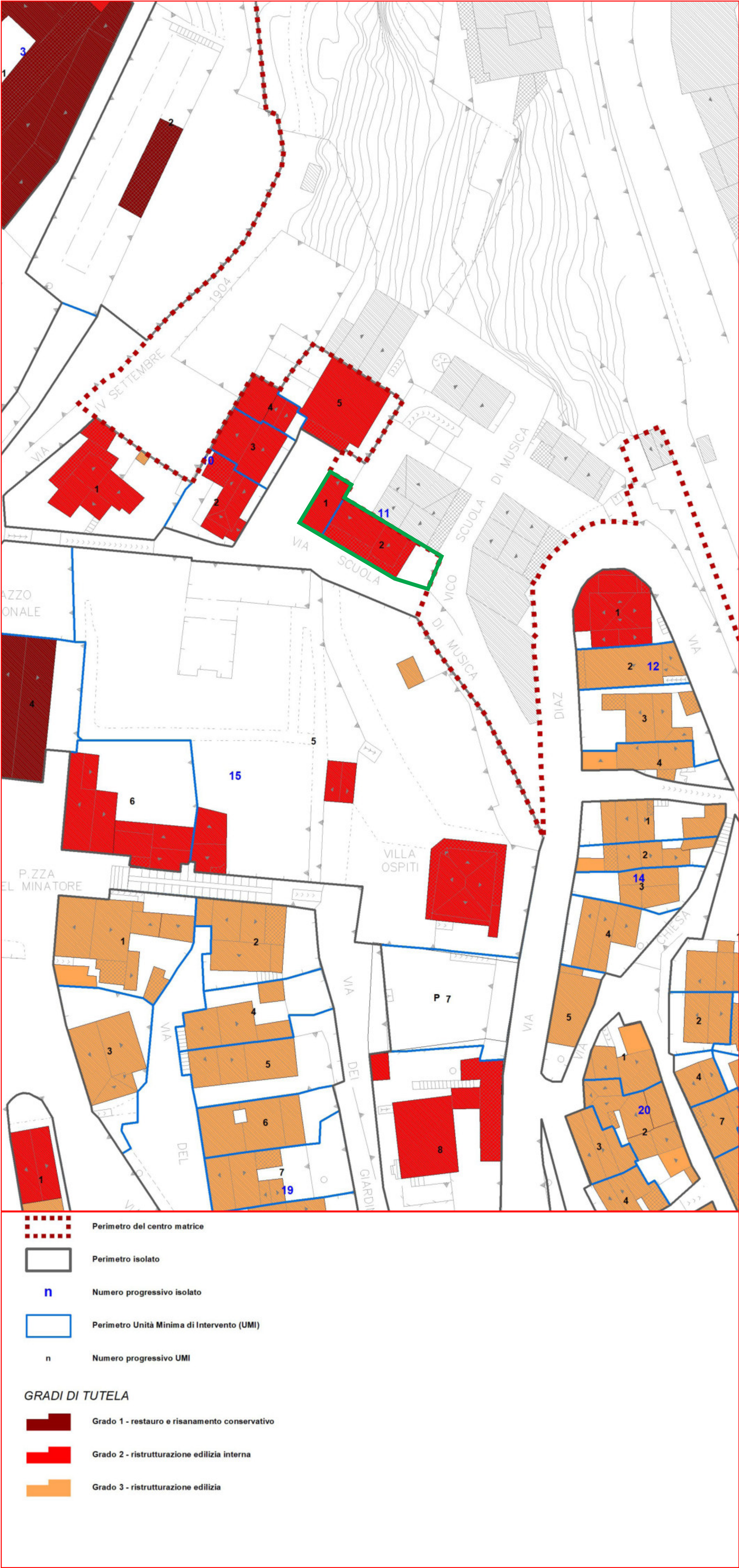
PROGETTO GRADI DI TUTELA 3D