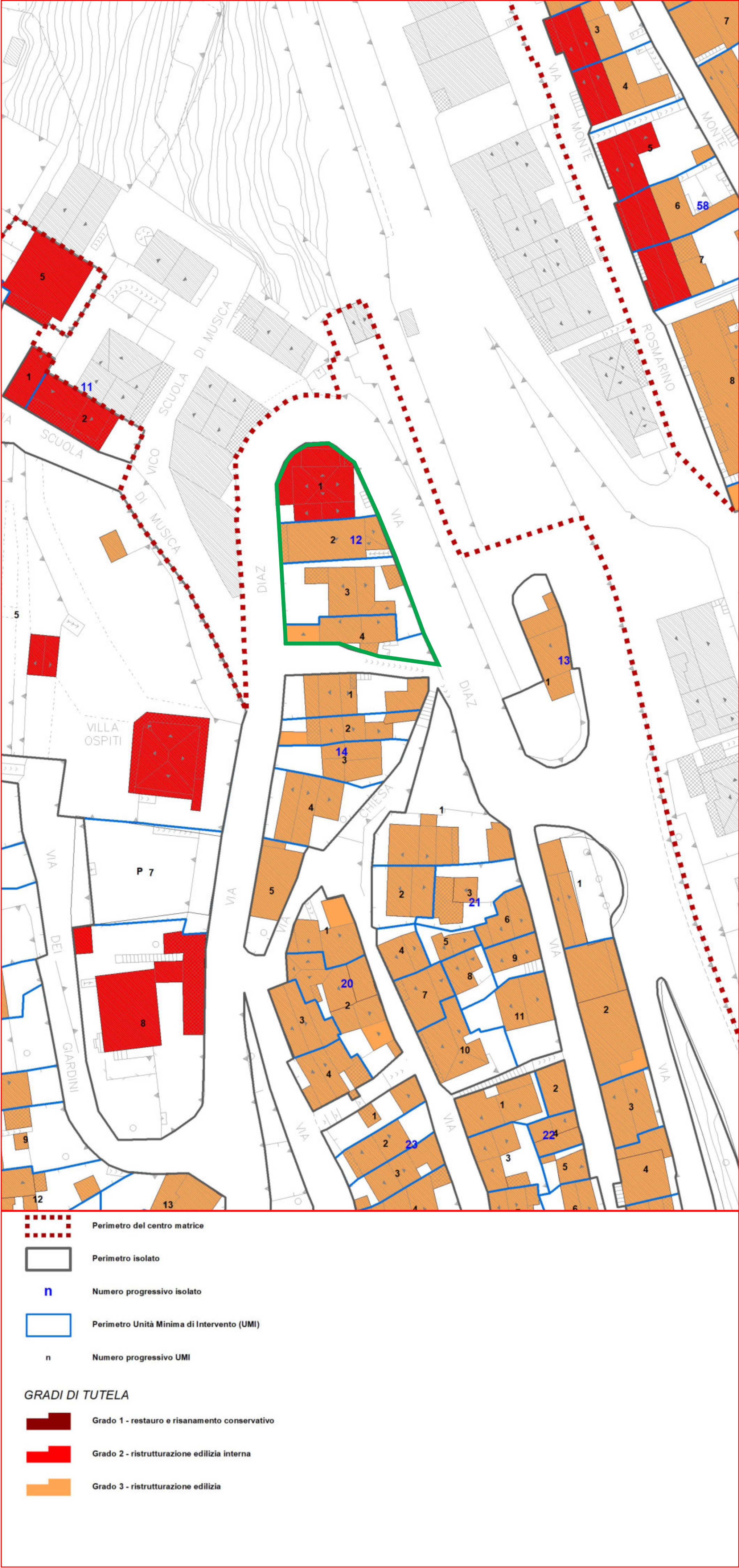
PROGETTO GRADI DI TUTELA 3D